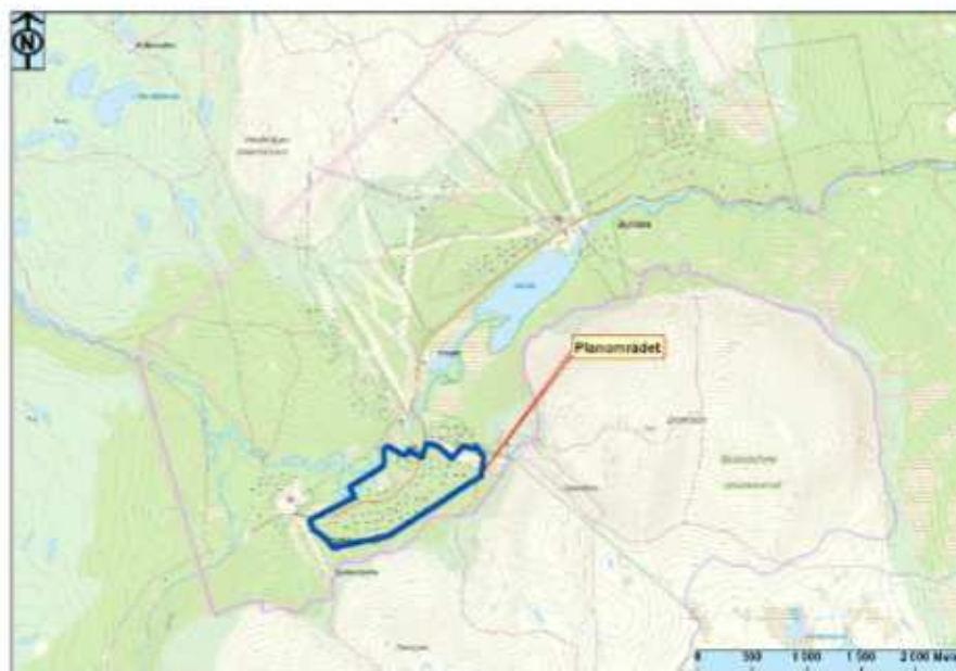
Karta 1. Visar planområdet.

Planområdet är beläget i Oviksfjällen, cirka tre kilometer sydväst om Bydalen och drygt tre mil sydväst om Hallen. Alldeles öster om planområdet finns Drommen. Länsväg 630 löper genom planområdet som delar in området i en södra och norra del. Den södra delen ligger i sluttning ner från fjället. Den norra delen vetter mot Storån.