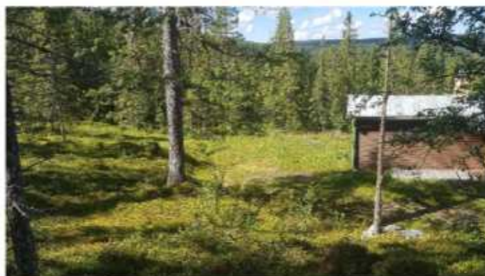
Bild 4. Ett av fritidshusen i området

Natur- och kulturmiljö Området karakteriseras av fritidshusbebyggelse i skogsnära läge. Naturmiljön utgörs av granbevuxen skogsmark som är typisk i de låglänta delarna av ett fjällområde. På olika ställen finns det stenrös som öppnar upp.