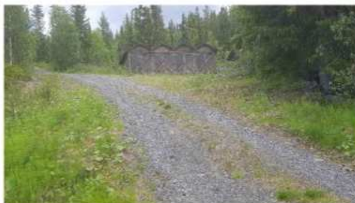
Bild 3. En av vägarna i planområdet. I planförslaget regleras marken som allmän platsmark för gata

Vägstandarden har dock varit i någorlunda likadant skick ända sedan området bebyggdes för 50 år sedan och nuvarande lösning har fungerat för området. Bedömningen är därmed den nuvarande lösningen ska kunna fortsätta användas och att inga nya vägsträckningar planläggs. Planen möjliggör dock att själva vägområdet kan breddas så att standarden kan förbättras där så är möjligt.