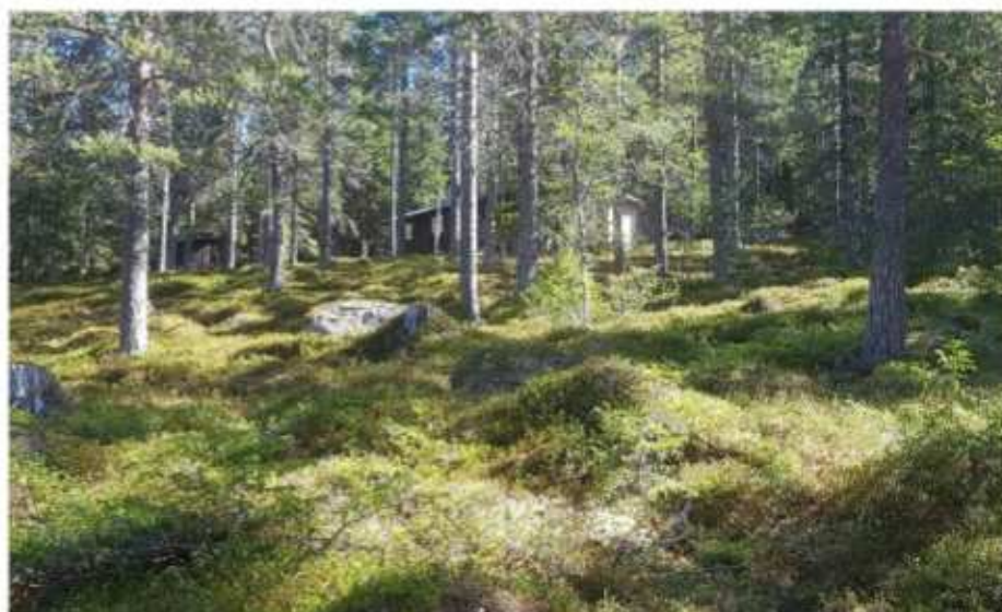
Bild 1. Visar typisk vegetation i planområdet