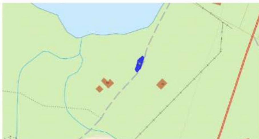
Bild 2. Visar outhägrad avgränsning av fornlämning RAÅ Hallen 365

Enligt Fornsök – Riksantikvarieämbetet finns en fornlämning, RAÅ Hallen 365, i den norra delen av planområdet på den nordvästra sidan av länsväg 630. Fornlämningen ligger i anslutning till elljusspåret och till befintliga fritidshus. I detaljplanen är marken i berörd del reglerad som allmän platsmark för natur/led. Det är dock så att fornlämnings avgränsning idag inte är känd, vilket innebär att den kan sträcka sig inom område för kvartersmark. Enligt kulturmiljölagen (1988:950) (KML) 2:6 är det förbjudet att utan tillstånd rubba, ta bort, gräva ut, täcka över eller genom bebyggelse, plantering eller på annat sätt ändra eller skada en fornlämning. Arbeten som berör fornlämningar kräver tillstånd från länsstyrelsen. Det innebär att allt arbete i fornlämnings närområde kan komma att kräva att arkeologiska åtgärder görs i form av en arkeologisk undersökning för att fastställa fornlämnings utbredning. Det behöver därmed samråd med länsstyrelsen om behovet av arkeologisk undersökning i enlighet med bestämmelse i KML 2:10-15 §§ innan ny bebyggelse kan uppföras inom berörd del av planområdet. Bild 2 visar område som kan tänkas beröras av fornlämnings.