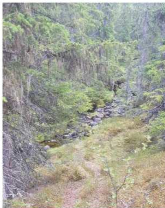
Bild 2. En av fjällbäckarna i området. I planförslaget regleras mark i anslutning till bäckarna som allmän platsmark för natur med hänsyn till buffertzoon och fri passage

I vissa delar inom området är marken ianspråktagen genom bebyggelse för enskilt ändamål utmed bäckarna. Där har den allmänna platsmarken för natur förlagts så nära bebyggelsen som möjligt – så att bäcken inte ingår i den nybildade fastigheten då arrendetomten fastighetsbildas.